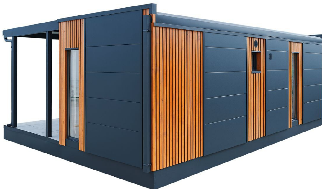
Zadnja strana pogled