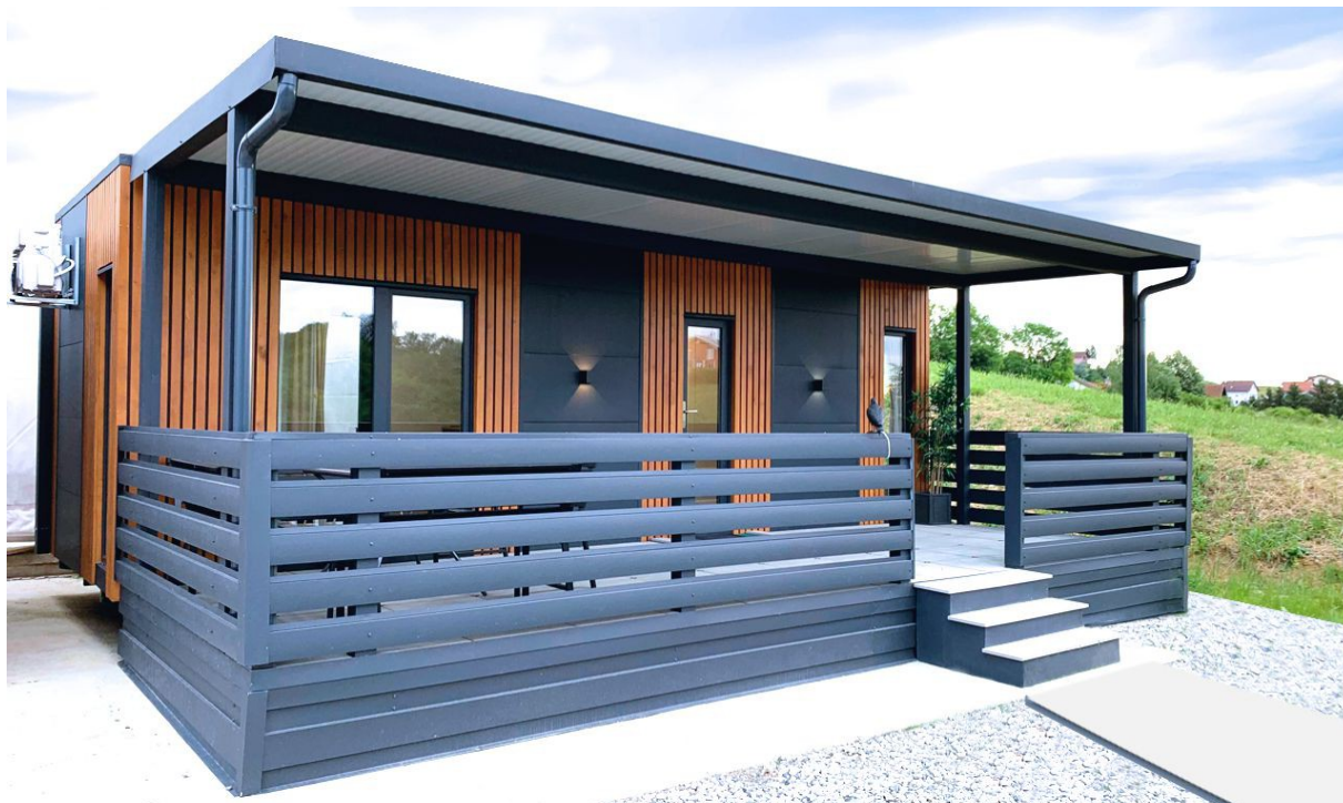
Prednja strana pogled